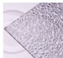
E – ledové krystaly čiré