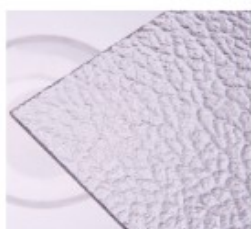
TK – dešťové kapky