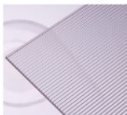
R – žebro