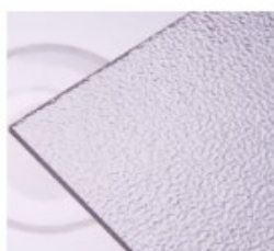
CL – jemný rastr