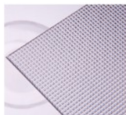
Z – pyramida