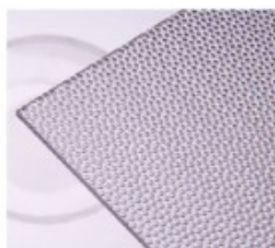
P – perla