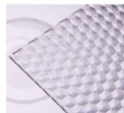
W – medové plástve

Prac. doba: Po-Pá 7,00-12,00 13,00-16,00