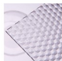
W – medové plástve