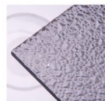
E – ledové krystaly šedé

Prac. doba: Po-Pá 7,00-12,00 13,00-16,00 Změna cen vyhrazena.