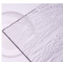
B – kůra