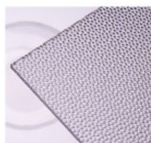
P – perla