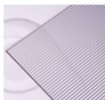
R – žebro