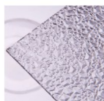
E – ledové krystaly čiré