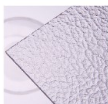
TK – dešťové kapky