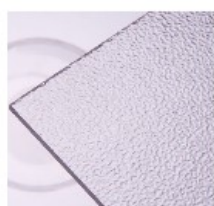
CL – jemný rastr