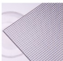
Z – pyramida